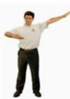
1 Bouddha étend ses mille bras

Par des mouvements d'éirement légers, le premier exercice permet de dégager tous les méridiens du corps, créant ainsi un fort champ d'énergie.